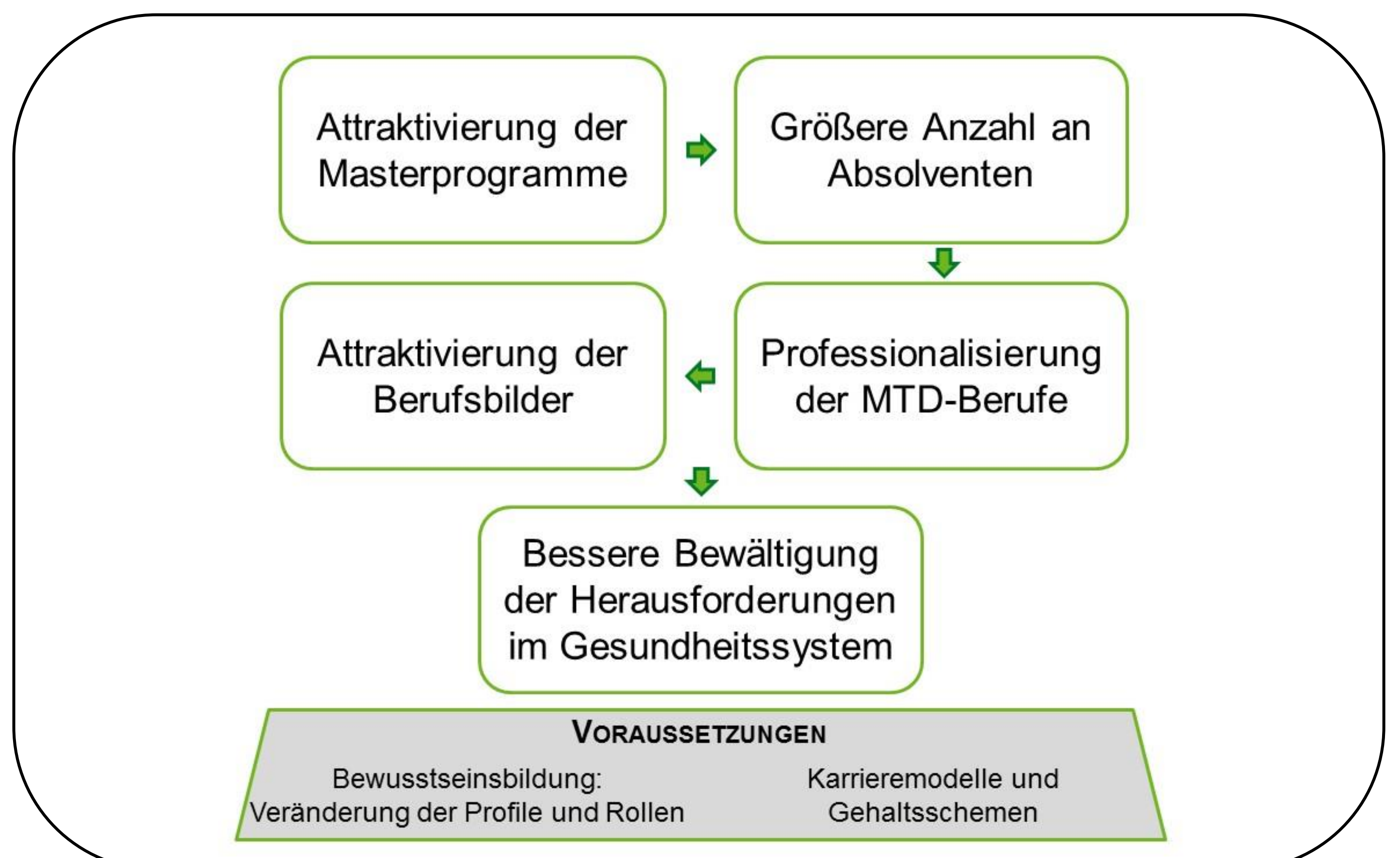
Abb. 2: Praktische Implikation

Sozialer (Soft Skills) sowie fachlicher Kompetenzzuwachs sind für die Erweiterung der Berufsprofile sowie die interdisziplinäre Zusammenarbeit – besonders in den in Österreich derzeit geplanten Primärversorgungseinheiten (entspricht in etwa den deutschen medizinischen Versorgungszentren) – vorteilhaft.